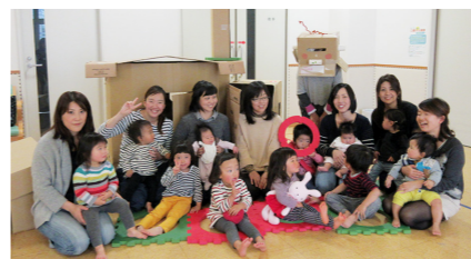
▲「ダンボールであそぼう」では、お母さんたちと作ったお家やスベリ台で遊びました。

毎日のニュースで、子どもを取り巻く環境に心痛めることもあります。この部屋で子どもや保護者の方と接していると本当に応援していきたいと思えます。今年も子どもたちの笑顔がいっぱい見れますようにと願って新年をスタートします。あそびに来てくださいね。待っています。