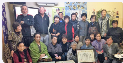
高齢者福祉功労者県知事表彰 優良老人クラブ表彰 笹尾二区老人クラブ