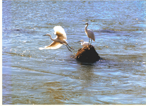
「桂川百景(京都)」