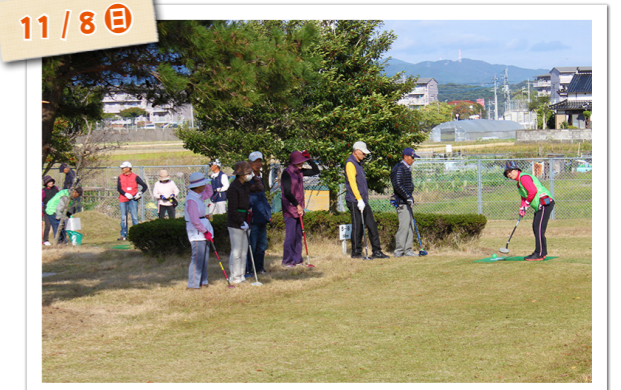
▲天然芝が心地よい桂川町グラウンド・ゴルフ場で220人が町長杯を競いました。