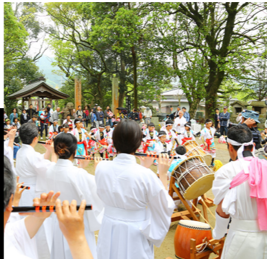
土師老松神社 例大祭(土師の獅子舞)

4月24日(日)、土師老松神社の例大祭が営まれ、地域住民など多くの人で賑わいました。上土師地区による子どもたちの廻り打ちや県指定無形民俗文化財「土師の獅子舞」のほか、神楽組による御神楽が奉納されました。