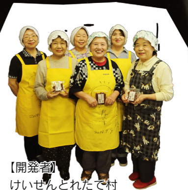
【開発者】 けいせんとれたて村 加工部「ひまわり」