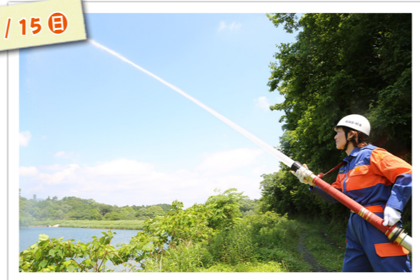
▲昨年発足した女性消防班も放水訓練に参加しました。