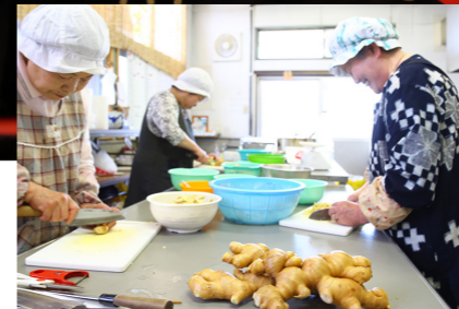
こだわりは「手切り」。スライスではなく手切りすることで、ショウガのうま味を引き出すことができるそうだ。

サクサクとした食感と鼻に抜けるショウガの香り。 かむほどに口の中に広がる甘辛いうま味が、食欲を増進させます。