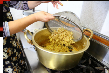
使用するショウガは、「見た目は大きく厚いが、切ると筋がなくやわらかい」という長崎県島原産のショウガ。