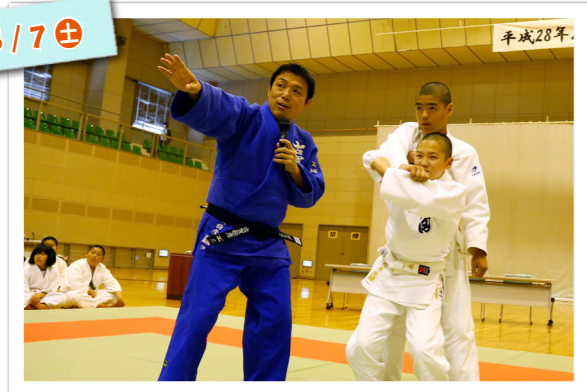
▲講演後の柔道教室では、実技を交えながら、技のかけ方や練習方法など実践的な指導を行いました。