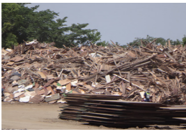
職員が派遣された西原村の災害廃棄物仮置き場。地震により発生した大量の廃棄物の受け入れと仕分けを行いました。