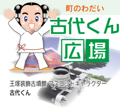
王塚装飾古墳館 マスコットキャラクター 古代くん