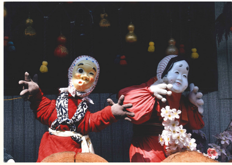
「いつも仲良し」