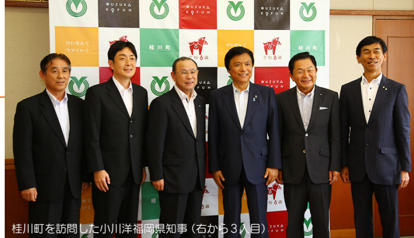
桂川町を訪問した小川洋福岡県知事(右から3人目)