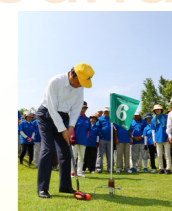
▲桂川町グラウンド・ゴルフ協会による案内で実際にプレー。もう少しでホールインワンというニアピンショットに、「やみつきになりそう」と小川知事。