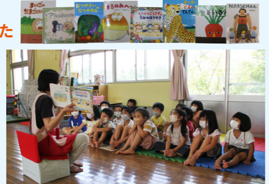
▲絵本の読み聞かせの様子（吉隈保育園） 絵本の中に出てくるお菓子を見て、「おいしそう」「食べてみたい」と大はしゃぎでした。