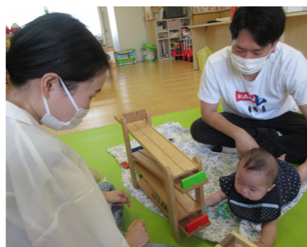
いいな～このひととき

青空に白い雲がモクモクと立ち昇るこの時期は、何歳になっても元気が出てきます。“ひまわりのたね”でも、寝返りをしそうで、あとひと踏ん張りがなかなかできない5ヶ月の子が何度も繰り返したり、ハイハイができるようになった子が滑り台の逆登りを始めたりと、成長と共によく動き元気に遊ぶようになりました。あるお母さんが、最近子どもから「お母さんが死んだらどうする？」とよく聞かれるようになり、子どもたちといろいろな話の中で、ウミガメが長生きをすることを知った1年生のお姉ちゃんが、「一緒にウミガメになろう」と答えたそうです。なんて素敵なんだろうと気持ちが温かくなりました。