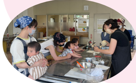
赤ちゃんたちも興味津々