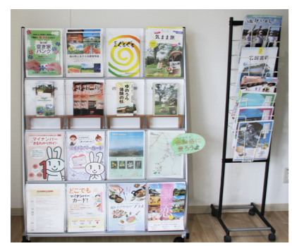
▲町報やパンフレットも設置しています。

新型コロナウイルスの感染状況や国・県の方針等により、適宜イベント等の延期・中止などを行う可能性があります。7月5日(火)発行の「広報けいせん7月号」に掲載されている情報も、 急遽変更 となる場合がありますので、ご了承ください。参加を希望するイベント等の 延期や中止については、「桂川町ホームページのトップ画面」に掲載 しています。また、詳細につきましては、各担当課に電話いただきますようお願いいたします。大変ご迷惑をおかけしますが、ご理解・ご協力の程よろしくお願ひします。