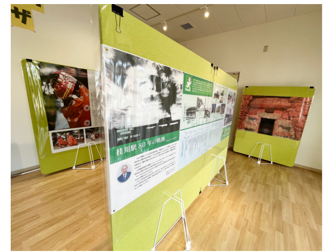
▲ミニギャラリーのコーナー