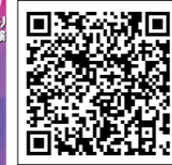
▲木下大サーカス公式サイト