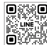
◀LINEでの相談も出来ます