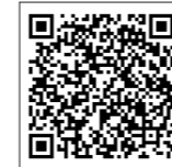
◀福岡県労働委員会のHPはこちら