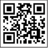
▲確定申告書等作成コーナー

令和6年分の確定申告は、ぜひご自宅から e-Tax をご利用ください。また、確定申告書の作成は、国税庁HPの「確定申告書作成コーナー」をご利用ください。