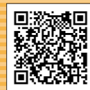
◀ゆのうら体験の杜 地図 (Google Mapが開きます)