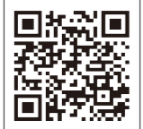
◀ 申込用 QR