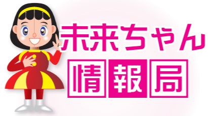
王塚装飾古墳館 マスコットキャラクター 未来ちゃん

【役場開庁日】月曜日～金曜日 (土曜・日曜日、祝日、年末年始は閉庁) 【役場開庁時間】8時30分～17時15分 (木曜日は19時まで一部の窓口が延長) 【町ホームページ】 http://www.town.keisen.fukuoka.jp/