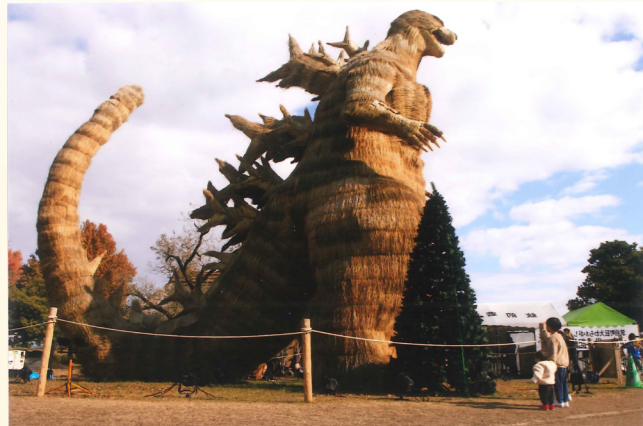
「ゴジラ(筑前町)」